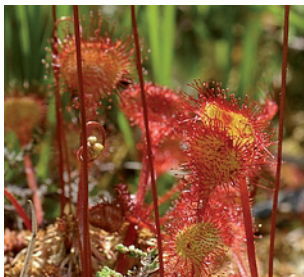
Rossolis à feuilles rondes

De nombreuses sphaignes rares pour le département sont présentes sur le site et ont été identifiées par le CBNPMP comme Sphagnum capillifolium , Sphagnum flexuosum ou Sphagnum rubellum .